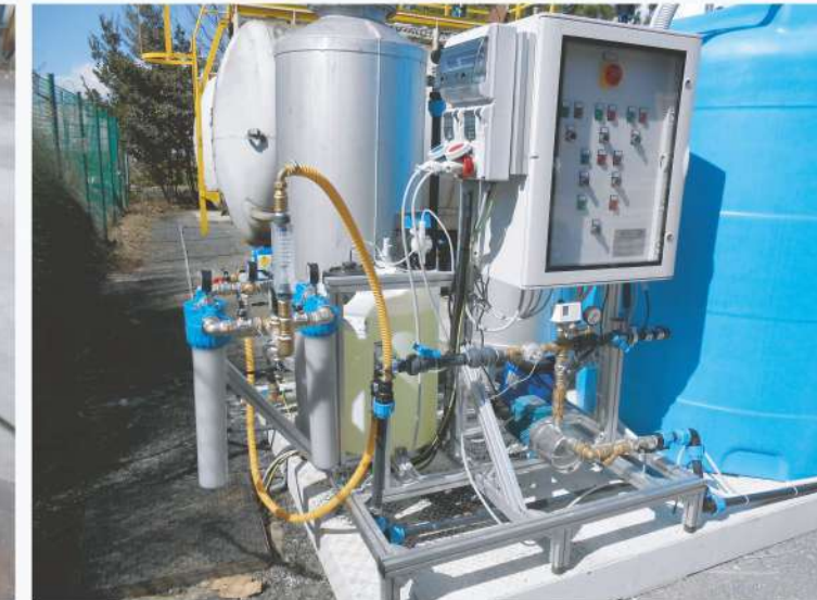
OFFICINA E SKID COMPLETI