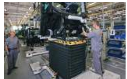
Condizioni di lavoro ideali grazie a postazioni di montaggio ergonomiche.