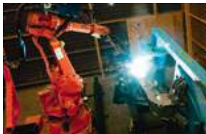
Numerosi lavori di saldatura vengono eseguiti per mezzo di robot, in modo estremamente accurato.

Con una precisione estrema, con molto tatto e meticolosità produciamo tutti i componenti integrandoli in un processo lavorativo dove tutti i pezzi sono a disposizione al momento giusto sulla linea di produzione, esattamente là dove devono essere montati. Tutti i processi di lavoro sono perfettamente coordinati, specialisti di discipline diverse lavorano a stretto contatto consentendo rendimenti giornalieri elevati e una qualità eccellente dei prodotti.