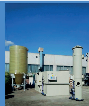
Fig.5 Collaudo Testing