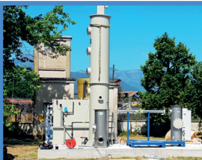
Fig.3 Esempio di installazione DESOLF-R® in Lazio Installation example DESOLF-R in Lazio