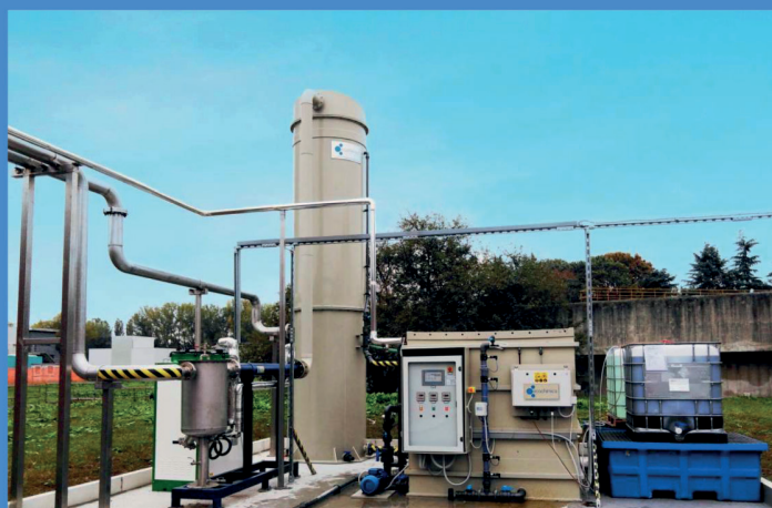
Fig.1- ECOCHIMICA DESOLF-R® installato in Lombardia ECOCHIMICA DESOLF-R® installed in lombardia

DESOLF-R® ECOCHIMICA towers find easy application in any area where there is a need to remove hydrogen sulphide from biogas.