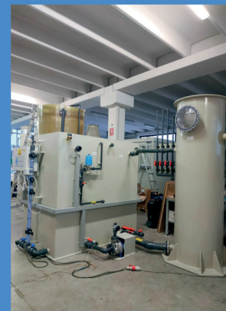
Fig.2 Collaudo DESOLF-R® DESOLF-R® test